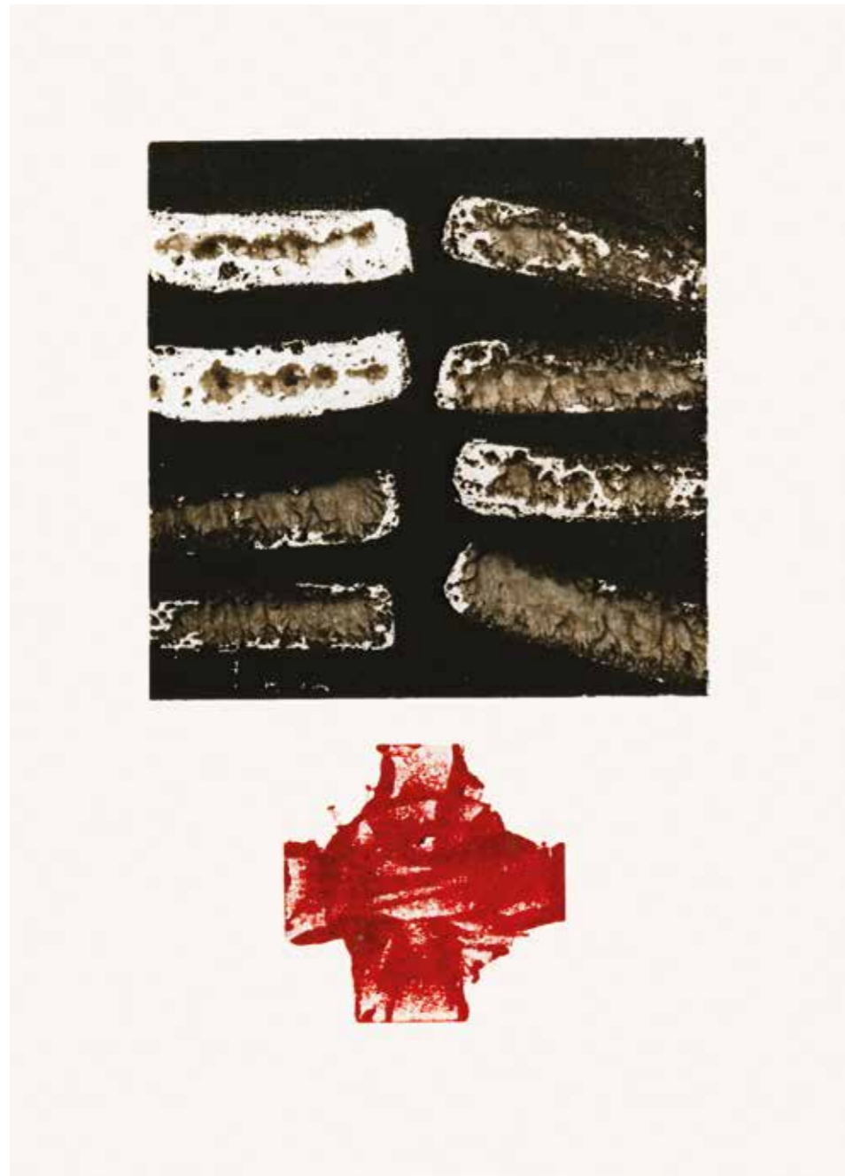
Monotypie • 50 x 40 cm • 1998