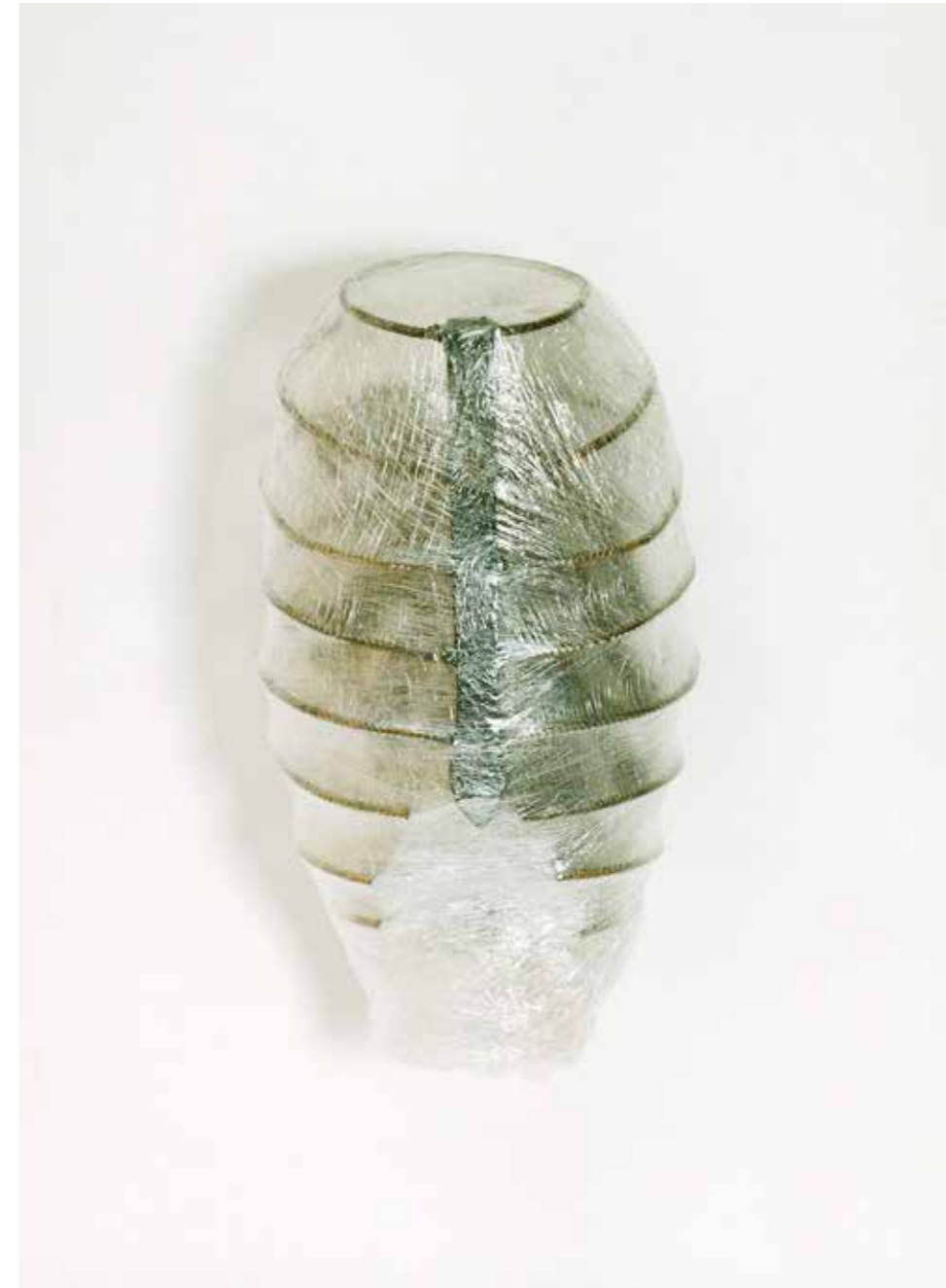
Eisen, Folie, Philodendronblatt • 50 x 30 x 30 cm • 1997