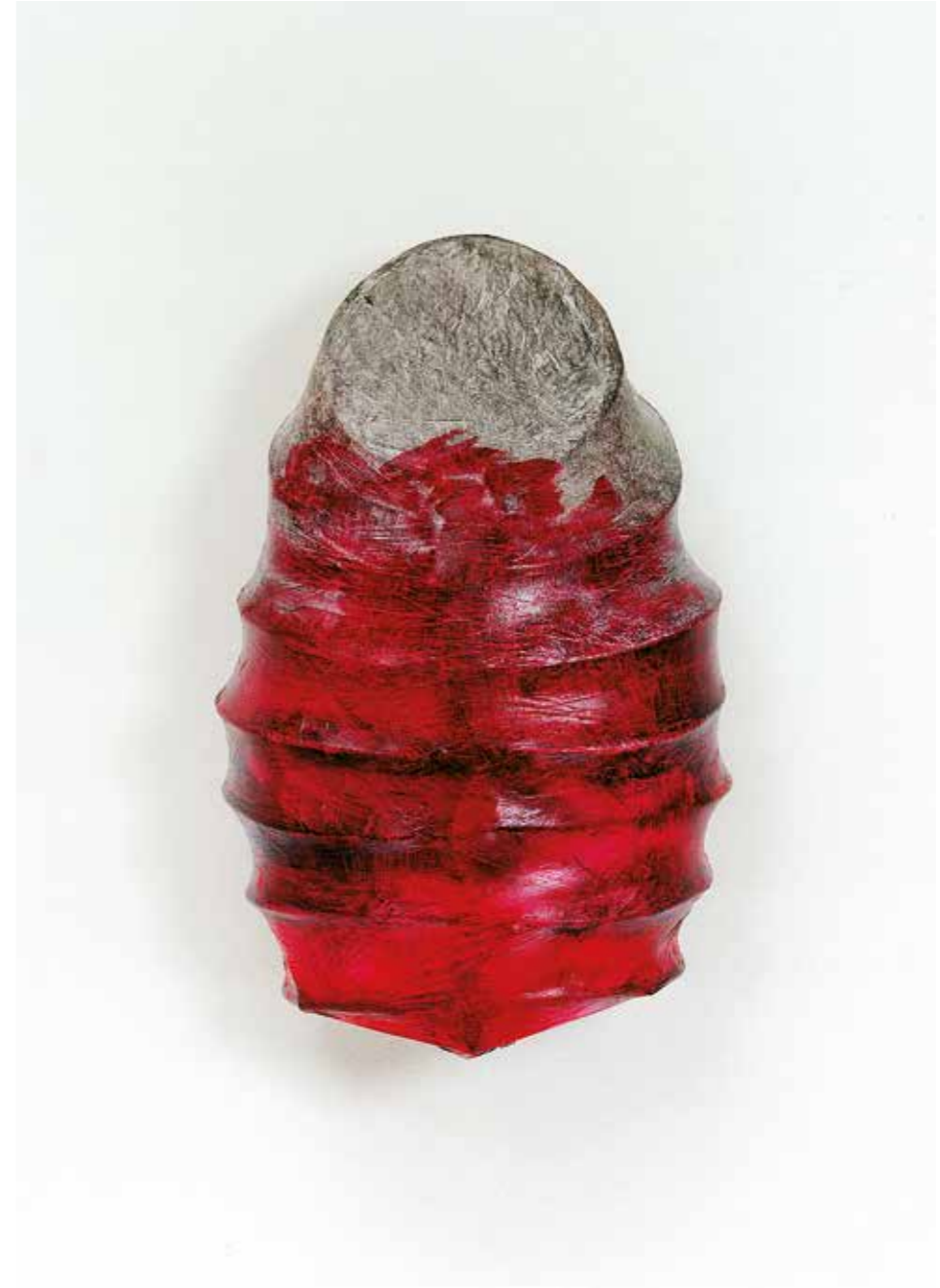
Eisen, Papier, Pigment • 60 x 35 x 30 cm • 2001