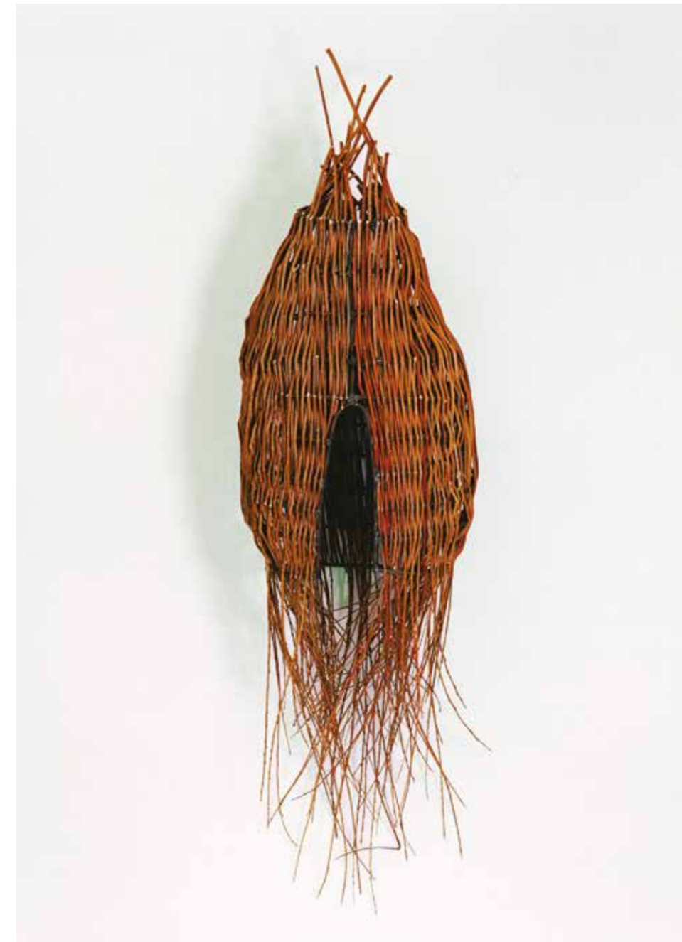
Eisen, Weidenruten • 230 x 50 x 40 cm • 1998

Elisabeth Brüggers Fähigkeit, Wesentliches herauszuarbeiten, es in klare Strukturen zu bringen, erhält nicht zuletzt in ihren Monotypien hervorragenden Ausdruck. Manchmal scheinen sie mir Kommentare zu den plastischen Werken zu sein, Pointierungen, oder um nach einer literarischen Analogie zu greifen: Epigramme.