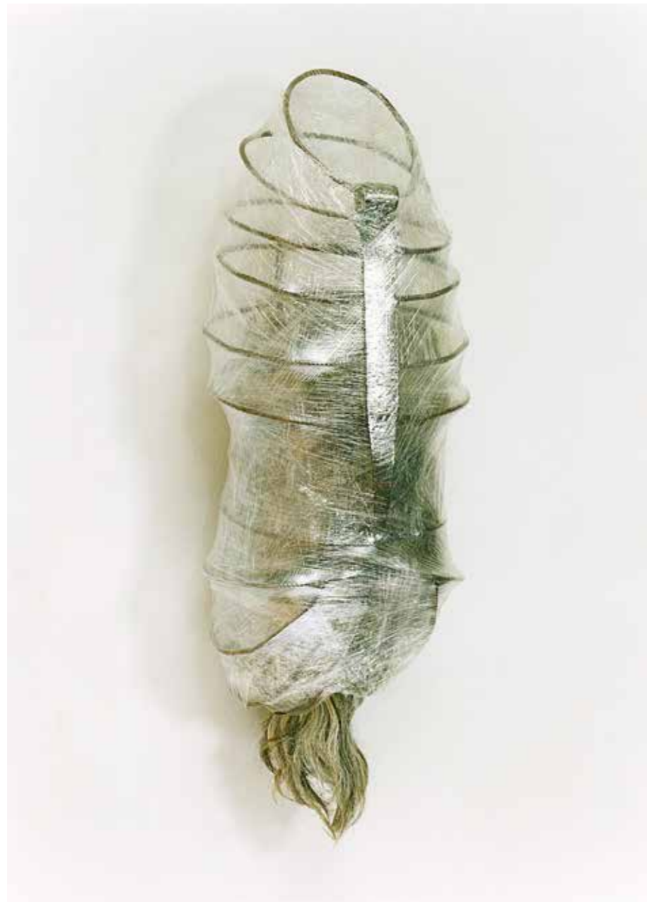
Eisen, Folie, Wolle • 90 x 30 x 30 cm • 1997