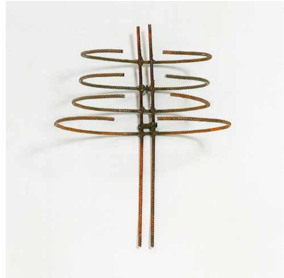
Eisen • 40 x 25 x 20 cm • 1997