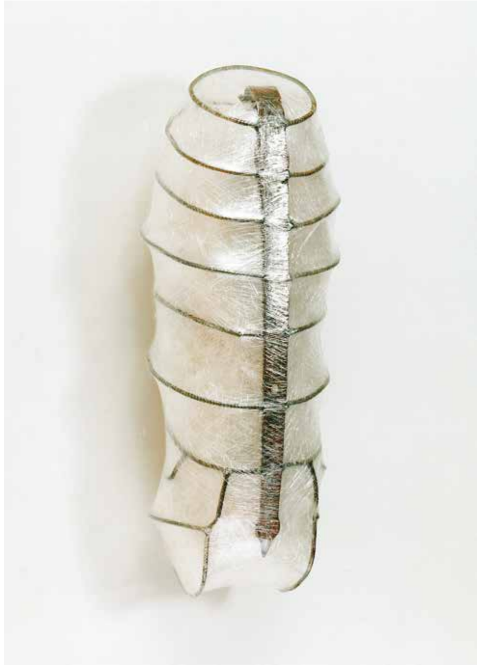
Eisen, Folie, Federn • 90 x 30 x 30 cm • 2000