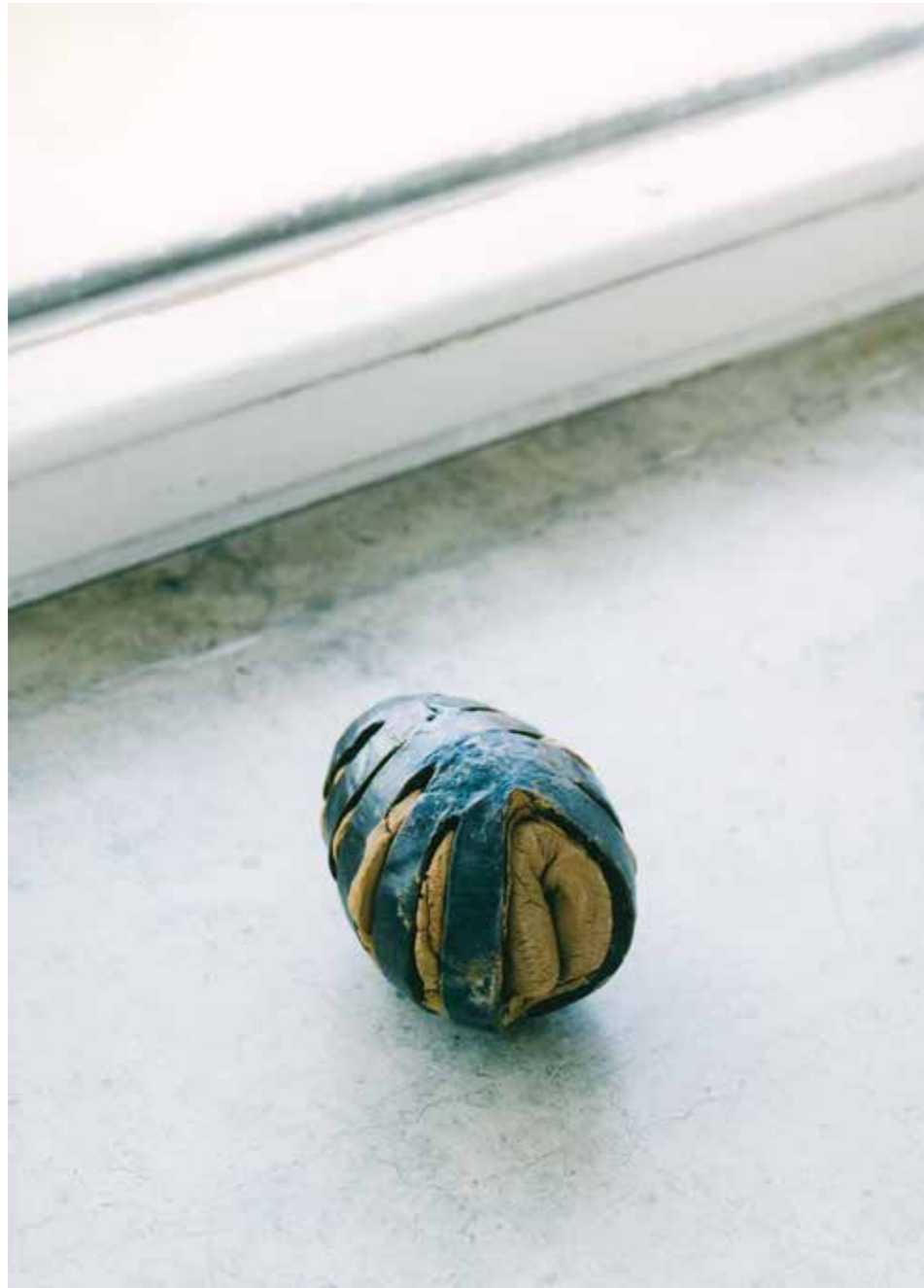
Bronze, ungebrannter Ton • 8 x 6 x 6 cm • 1998