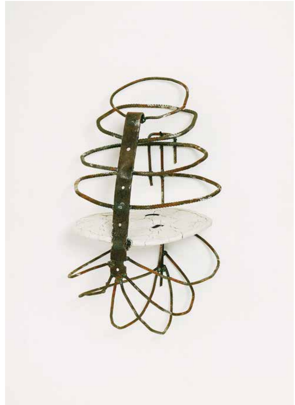
Eisen, ungebrannter Ton • 50 x 40 x 35 cm • 1999