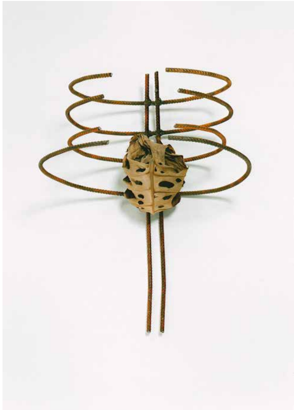
Eisen, Philodendronblatt • 40 x 20 x 20 cm • 1999