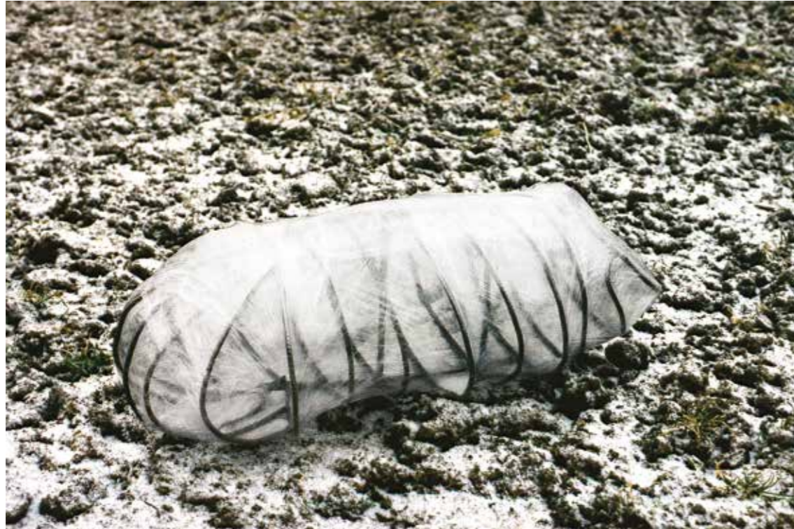
Eisen, Folie • 90 x 30 x 25 cm • 1996