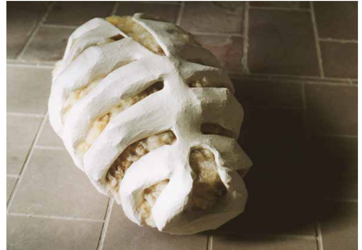
Eisen, Papier, Wolle • 90 x 57 x 450 cm • 1996