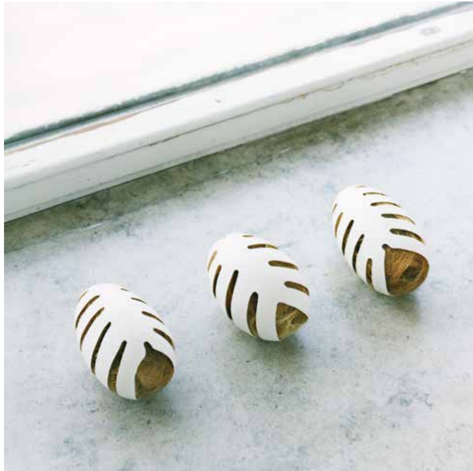
Gänseeier, Kinderhaar • je 8 x 6 x 6 cm • 1998